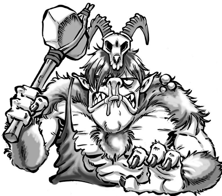
Troll du Froid, par Guillaume Albin

Note concernant les montures : en dehors des chevaux vendus spécialement pour ce type de voyage et proposés dans le tableau ci-dessus, vous pouvez traverser les montagnes avec les montures spéciales suivantes : cheval mort-vivant, destrier démoniaque, sanglier gagrouk, yakak (dompté sur place), horreur osseuse, brebiphant, et bien sûr les montures volantes épiques résistant au froid. Toutes les montures terrestres voyageront à un maximum de 25 km/jour. Il est également possible de voyager sur mammouth, tigre des sommets ou d'autres animaux recrutés localement (sous réserve que vous en ayez les compétences), mais c'est à vos risques et périls.